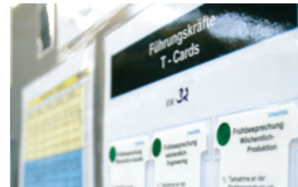
Disciplina e dar exemplo ao invés de esperar acontecer e postura hierárquica