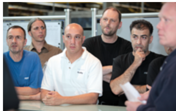
Team building e pensamento no fluxo de valor ao invés de pensamento departamental