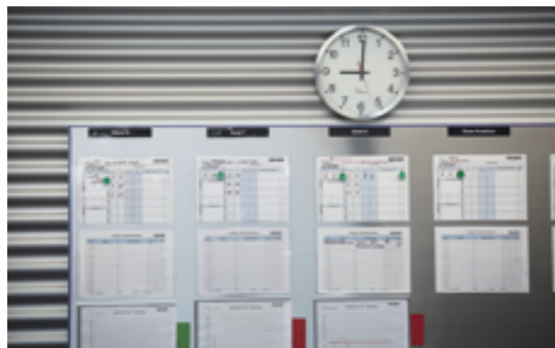
Transparência e foco ao invés de autorização de acesso e excesso de informação