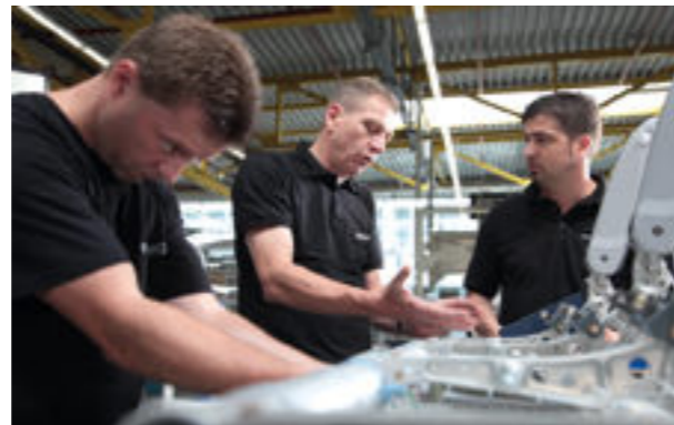
Coaching e desenvolvimento ao invés de longas palestras