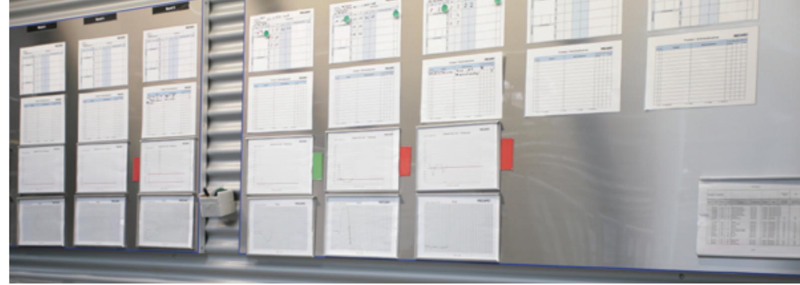
“Gestão em 5 minutos” ao invés de apresentação de 50 minutos

A visualização transparente de dados chave e o grau em que as ações são implementadas servem para melhorar o desempenho da gestão. A facilidade para compreensão e gestão é um fator-chave. O colaborador precisa ser capaz de manter a visualização atualizada com mínimo esforço e o gerente identificar a necessidade de ação à primeira vista.