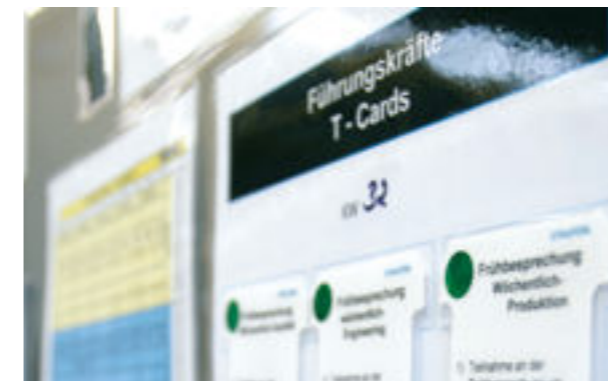
Disciplina e dar exemplo ao invés de esperar acontecer e postura hierárquica