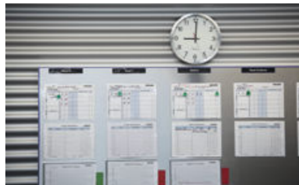
Transparência e foco ao invés de autorização de acesso e excesso de informação