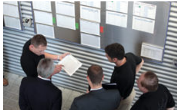
“Go & See” ao invés de “reunião e e-mail”