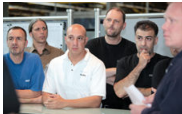
Team building e pensamento no fluxo de valor ao invés de pensamento departamental