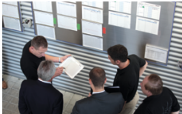
“Go & See” ao invés de “reunião e e-mail”