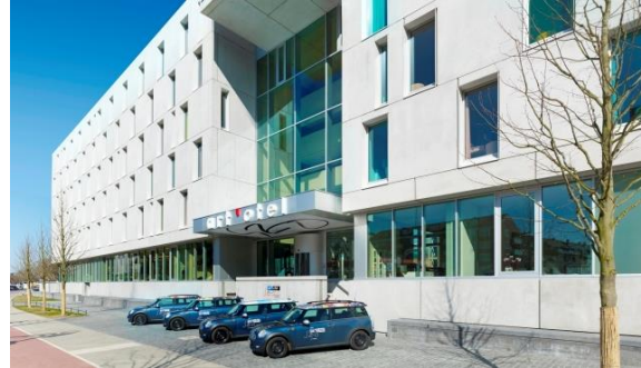
Art'otel Cologne Holzmarkt 4 50678 Köln Tel.: + 49 221 801 030 www.artotels.com