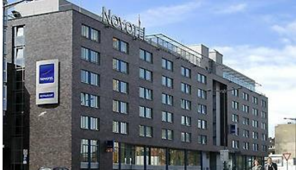
Novotel Köln City Bayenstrasse 51 50678 Köln Tel.: +49 221 801 470 www.novotel.com