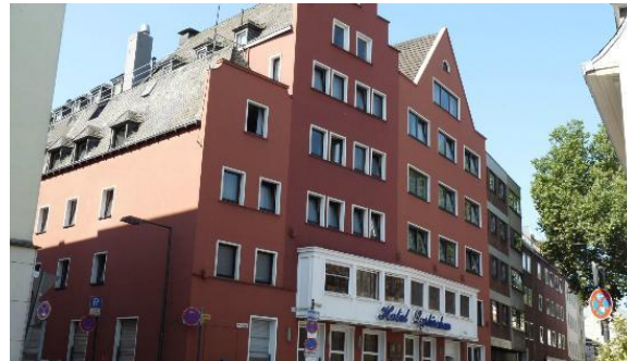
Lyskirchen Filzengraben 26-32 50676 Köln Tel.: +49 221 2097 718 lyskirchen@eventhotels.com