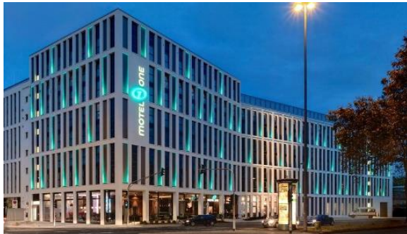
Motel One Waidmarkt Tel-Aviv-Straße 6 50676 Köln Tel.: +49 221 272 595 0 www.motel-one.com