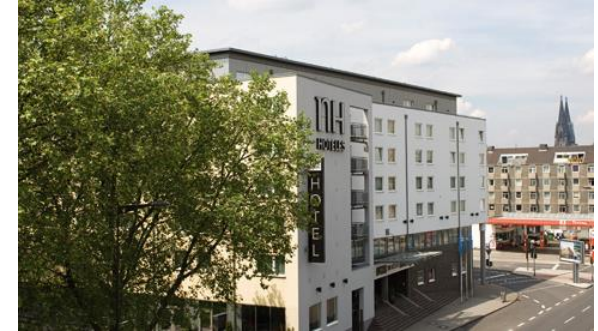
NH Köln City Holzmarkt 47 50676 Köln Tel.: +49 221 2722 880 www.nh-hotels.de