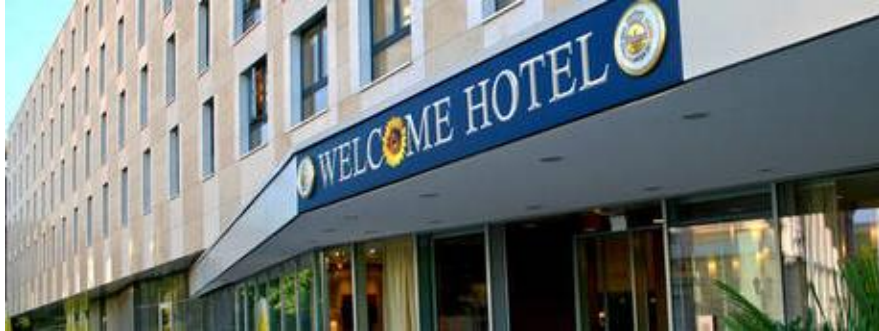
Welcome Hotel Karolinenplatz 4 64289 Darmstadt Tel: +49 6151 3914-0 www.welcome-hotels.com