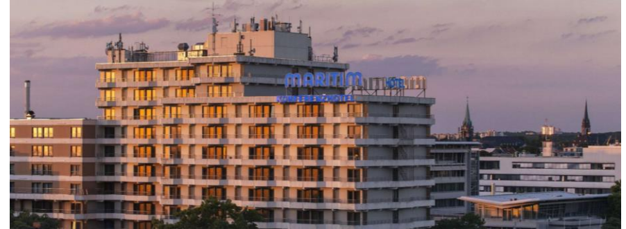
Maritim Konferenz Hotel Rheinstraße 105 64295 Darmstadt Tel: +49 6151 8780 www.maritim.de