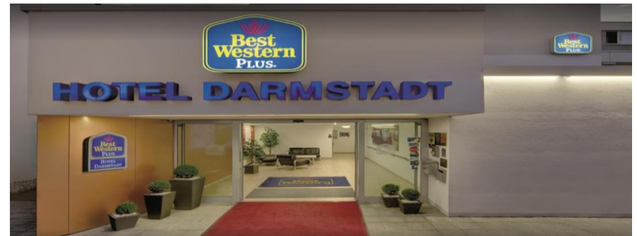
Best Western Hotel Grafenstr. 31 64283 Darmstadt Tel: +49 6151 281 00 www.hotel-darmstadt.bestwestern.de