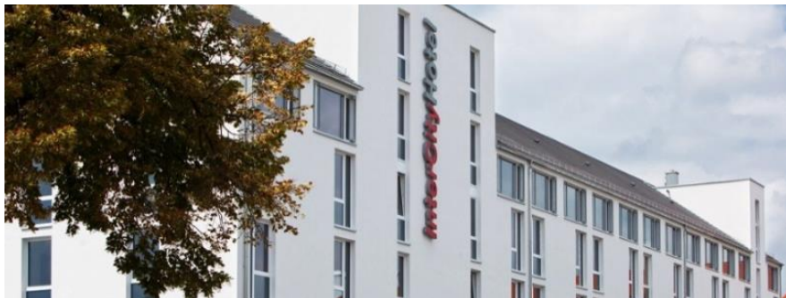
Inter City Hotel Poststraße 12 64293 Darmstadt Tel: +49 6151 906 910 www.intercityhotel.com